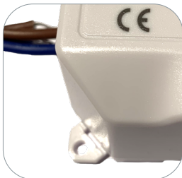
Fijación para montaje en superficie