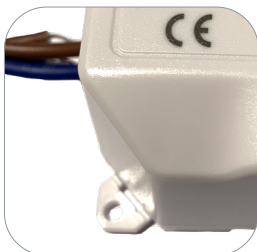
Fixation pour montage en saillie